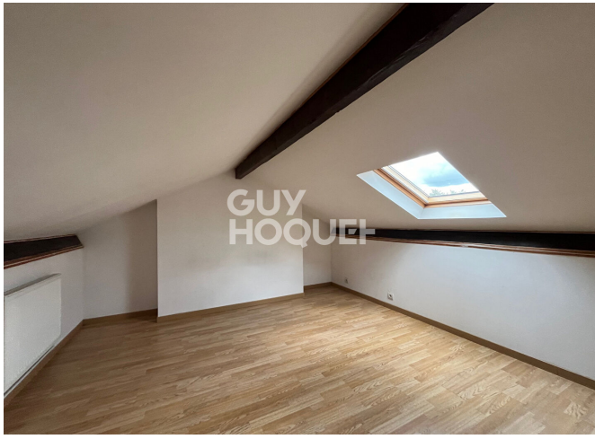
Photo du bien